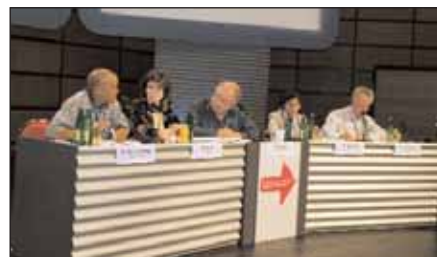
Во время Съезда прошло три круглых стола, в том числе — «Принимаем вызов оффшоринга»