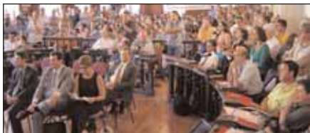
Рабочие DC протестуют в здании городского совета Жуис-ди-Фора, Бразилия

Хотя решение компании собирать здесь Mercedes C-класса и обеспечит работу завода, но, по мнению профсоюза, это не сможет гарантировать предприятию надежного будущего. «Мы знаем, что завод, построенный в расчете на производство 70,000 машин в год, никогда не станет прибыльным, если здесь будет производиться лишь сборка из готовых деталей,» — отметил представитель профсоюза. К тому же, производство на базе СКД («полностью разобранный») не гарантирует занятость для рабочих местных компаний-поставщи-