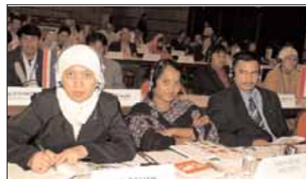
Часть делегации Малайзии