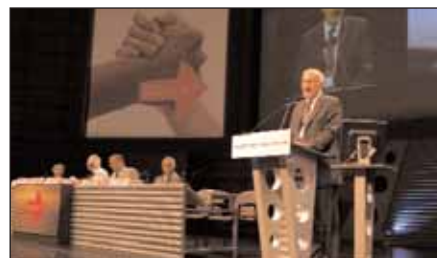
Президент МФМ Юрген Петерс приветствует делегатов