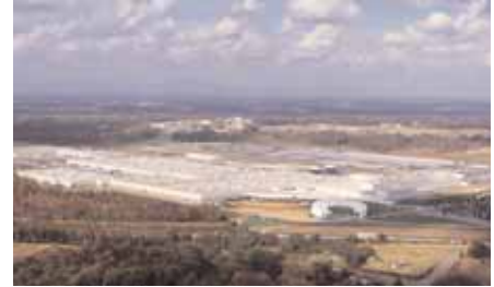
Завод BMW в Спартанбурге, США.

Текст Соглашения на немецком и английском языках доступен на сайте МФМ. На других языках текст будет публиковаться по мере появления переводов. АГ