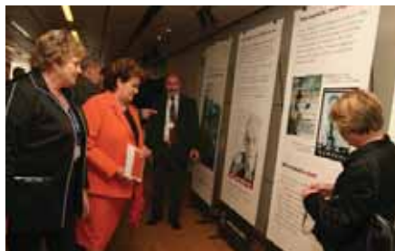
Делегаты изучают стенд «Асбест убивает» на Съезде МФМ

Дальнейшие действия МФМ в рамках этой кампании включают в себя работу по введению запрета на асбест Конференциями МОТ в этом и следующем году, а также просветительская деятельность во взаимодействии с другими Федерациями Глобальных Профсоюзов, в том числе, Международной Федераци-