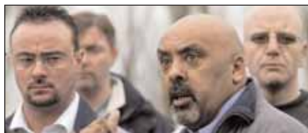
Рабочие MG Rover разочарованы: тысячи лишатся своих мест.

Генеральный Секретарь Профсоюза транспортных и неквалифицированных рабочих Тони Вудли заявил, что сейчас профсоюз проводит срочные переговоры с адми-