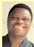
Наполеон Кпох ICU, Гана

«Оффшоринг — один из самых значительных вызовов, с которым сталкиваются профсоюзы в Индии. Наш профсоюз работает в этом направлении, проводя профсоюзные мероприятия, направленные на повышение информированности среди рабочих, не состоящих в профсоюзе».